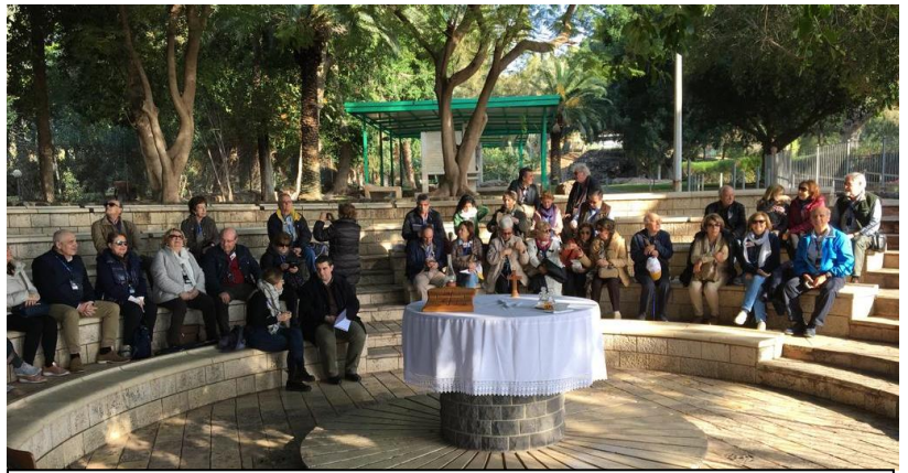
En el Primado de Pedro, Lago Tiberiades

Es habitual que los que han visitado Tierra Santa, cada vez que se leen los pasajes del Evangelio, ya tienen la imagen del sitio donde sucedió el Sermón de las Bienaventuranzas, o el primado de Pedro, el huerto de los olivos o el Sepulcro del Señor donde resucitó.