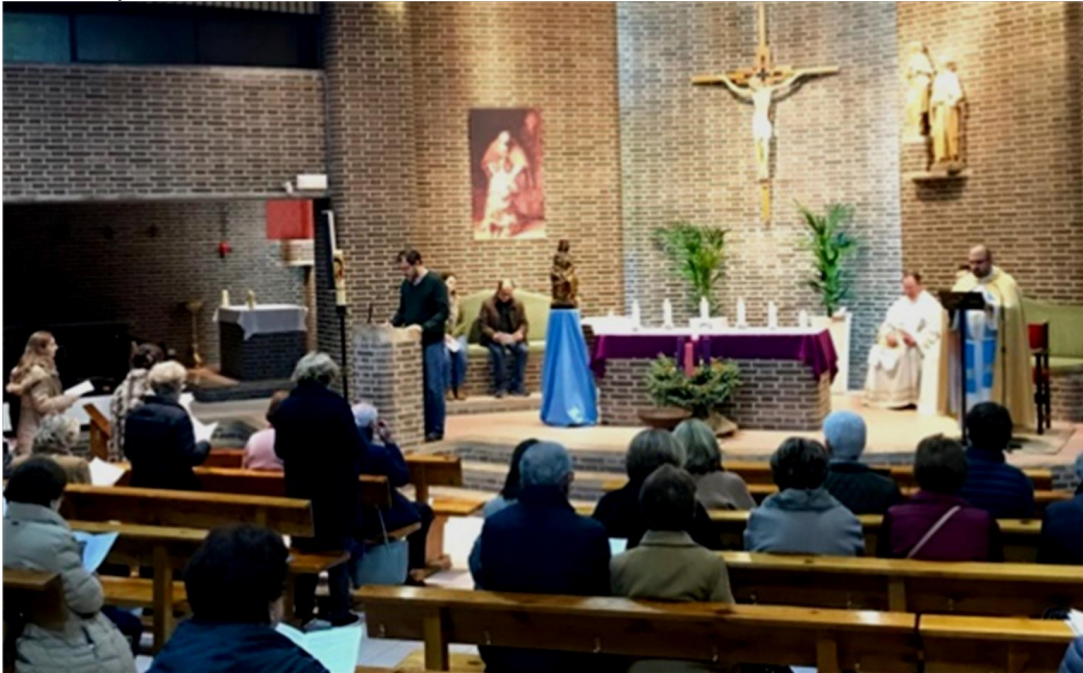
Un momento de la Vigilia de la Inmaculada que tuvo lugar el pasado viernes

Inmaculada Virgen María, en tus entrañas de Madre Virgen, comenzó la Alianza de salvación del género humano. Contigo, la Virgen Iglesia espera: ¡Marana tha! ¡Ven, Señor Jesús!