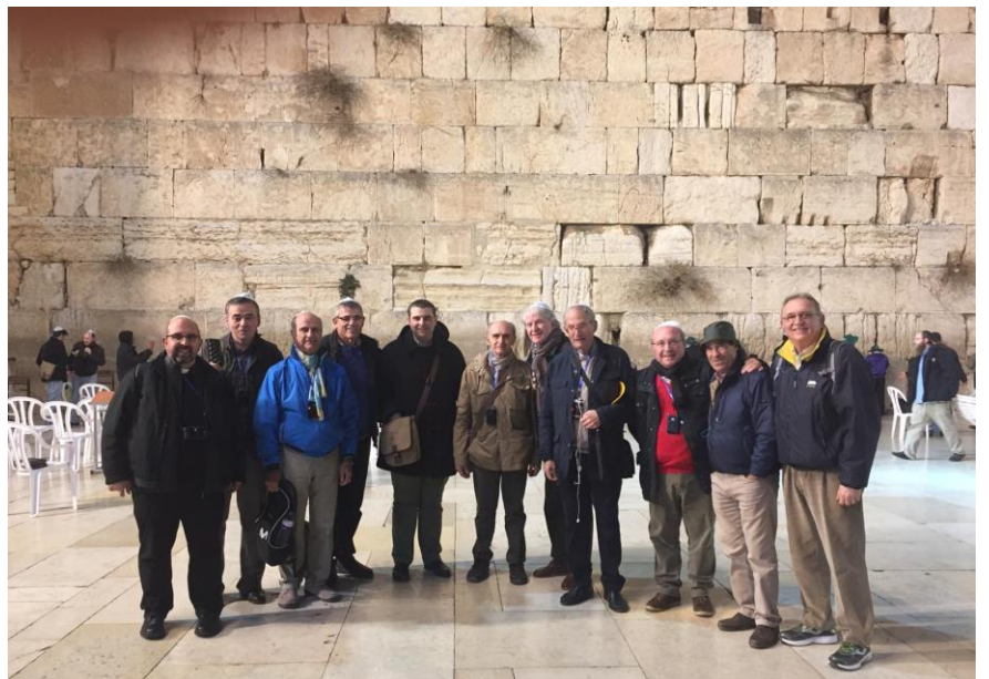
En el Muro de las Lamentaciones, Jerusalén

Además, puedes conocer mejor la historia y costumbres de los pueblos que habitaron y habitan en Israel, las diferentes confesiones religiosas, su geografía tan dispar en muy pocos kilómetros, donde pasas del desierto más árido que ves al visitar las cuevas de Qumram al vergel del río Jordán, o como el Mar Muerto y el lago de Tiberiades. También los sicomoros en la ciudad de Jericó.