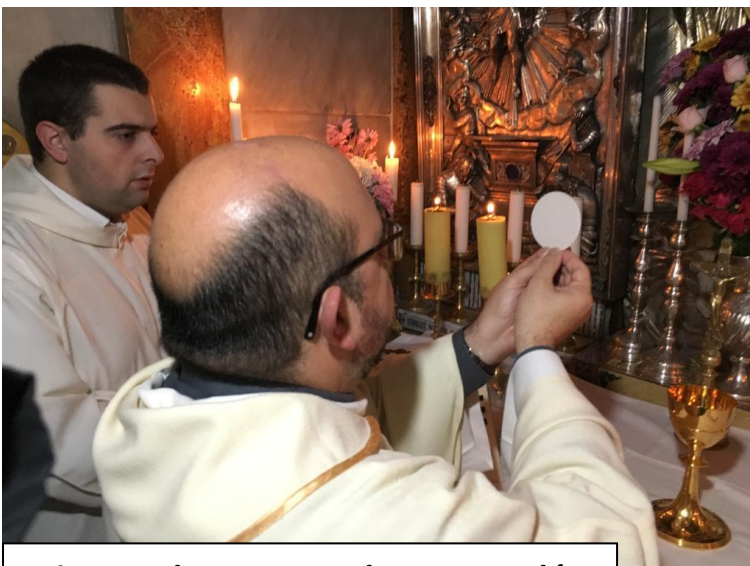
Misa en el Santo Sepulcro, Jerusalén

Seguro que a la vuelta del viaje nos darán buena cuenta de todo lo que han vivido en estos días de peregrinación. Vaya como testimonio este pequeño reportaje gráfico que nos han ido enviando estos días.