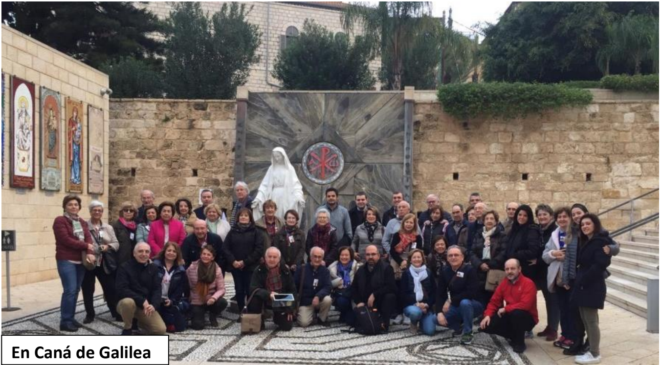
En Caná de Galilea

“Que alegría cuando me dijeron, vamos a la casa del Señor, ya están pisando nuestros pies tus umbrales, Jerusalén”