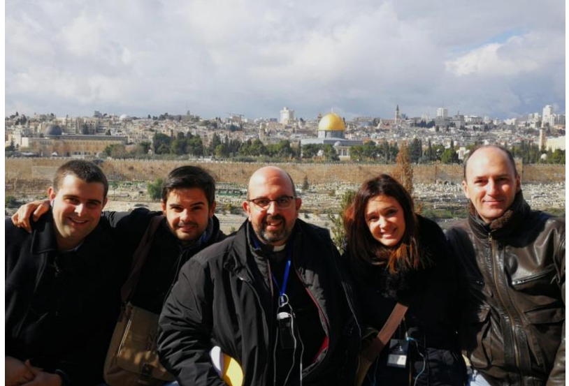
En Jerusalén, desde el Monte de los Olivos

“Que alegría cuando me dijeron, vamos a la casa del Señor, ya están pisando nuestros pies tus umbrales, Jerusalén”