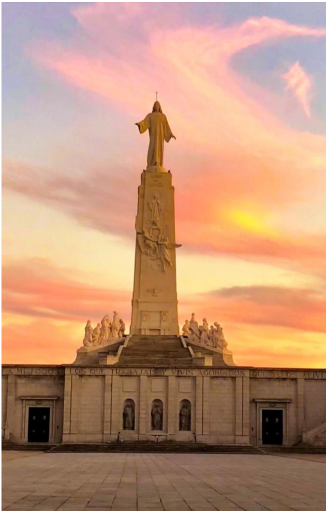
Monumento al Sagrado Corazón de Jesús Cerro de los Ángeles (Getafe)

El nuncio del Papa, Francesco Ragonesi, lo bendijo. Luego, el arzobispo de Madrid, Prudencio Melo, presidió la Santa Misa. Antes de la bendición final se leyó un telegrama del papa Benedicto XV. El nuncio impartió la bendición papal y, a continuación, se expuso solemnemente el Santísimo Sacramento. Estando entonces arrodillados todos los presentes, el rey Alfonso XIII, de pie, en nombre del pueblo español, hizo lectura solemne de la oración mediante la cual se expresaba públicamente la consagración de España al Sagrado Corazón de Jesús: “España, pueblo de tu herencia y de tus predilecciones, se postra hoy reverente ante ese trono de tus bondades que para Ti se alza en el centro de la Península... Reinad en los corazones de los hombres, en el seno de los hogares, en la inteligencia de los sabios, en las aulas de las ciencias y de las letras y en nuestras leyes e instituciones patrias”.