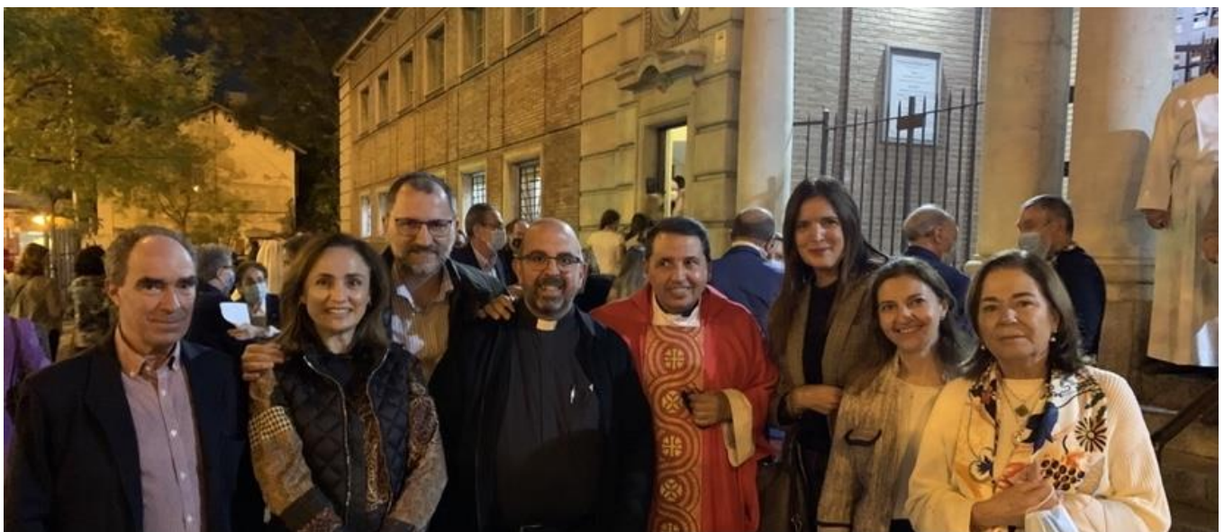
Algunos de los miembros del consejo pastoral que asistieron a la apertura de la visita pastoral

En la Oración final pedimos al Señor que “nos conceda a todos nosotros, sacerdotes, consagrados y laicos comprender y acoger el misterio de gracia de la Visita Pastoral que nos disponemos a comenzar, poniéndola bajo la protección de Santa María de la Almudena, Madre tuya y Madre de la Iglesia de Madrid.